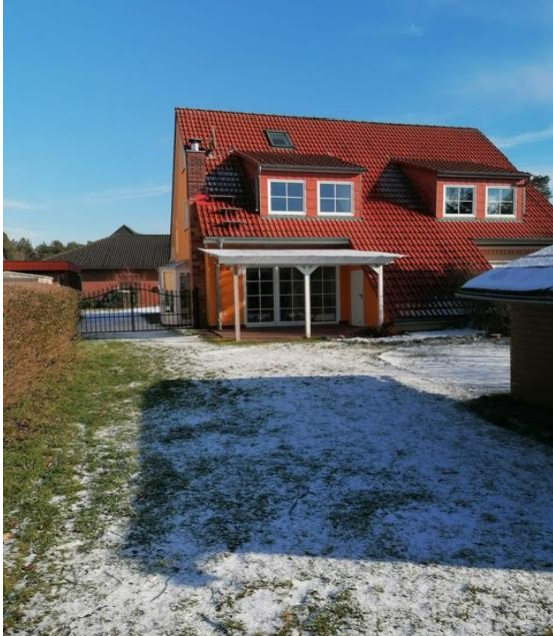
Rückseite des Hauses