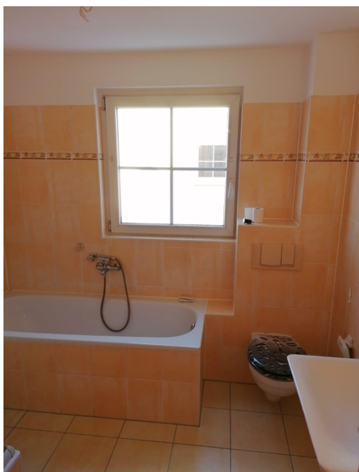
Bad mit Dusche und Badewanne